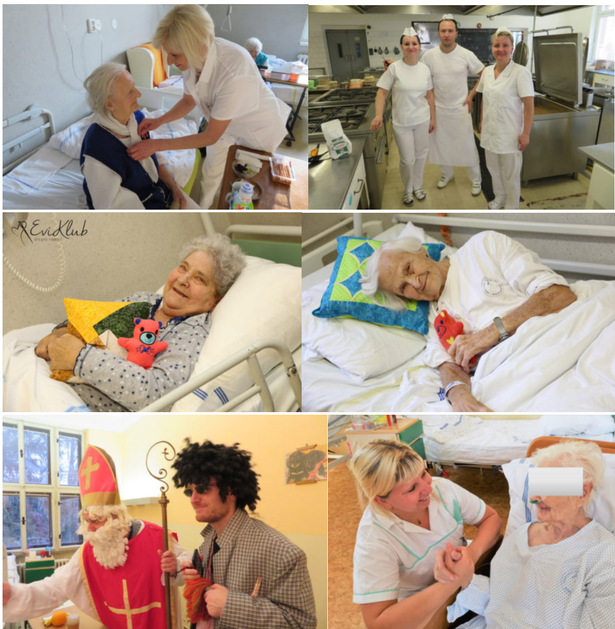
Foto: Zaměstnanci zpestřují hospitalizaci pacientům, a to nejen v době významných událostí.

Zařízení trvale vytváří podmínky pro zvyšování kvality poskytované zdravotní péče, spokojenost a rodinnou atmosféru na odděleních následné péče.