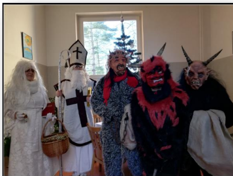
Foto: Zaměstnanci zpestřují hospitalizaci pacientům, a to nejen v době významných událostí.

Zařízení trvale vytváří podmínky pro zvyšování kvality poskytované zdravotní péče a zajištění komplexní a moderní péče o pacienty komplexní moderní následnou péči.